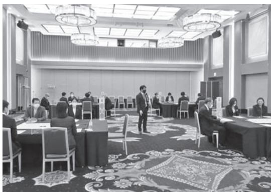
4グループに分かれて活発な意見交換会が行われた