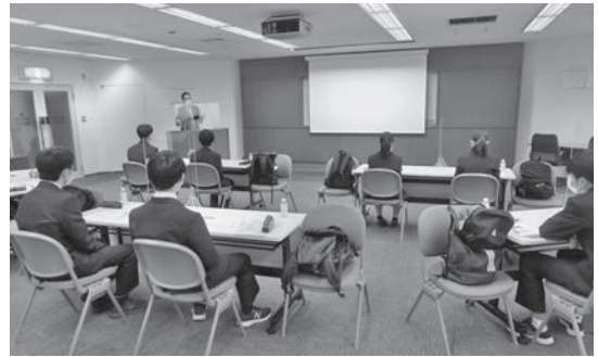
野村証券 株式会社