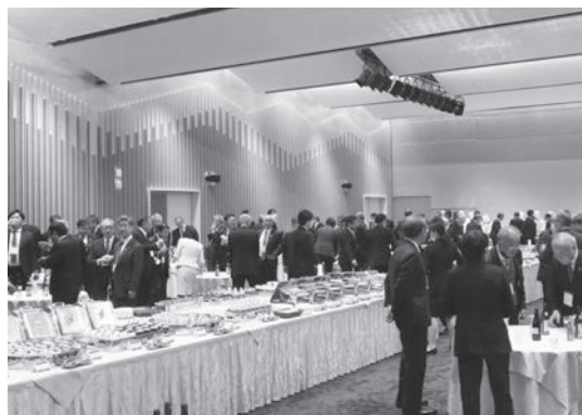
夕食懇談会の様子