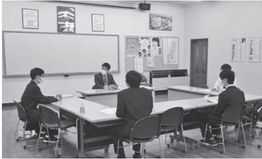
群馬ヤクルト販売 株式会社