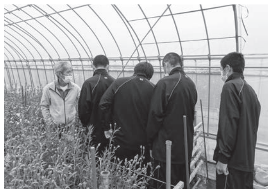
カネコ種苗 株式会社