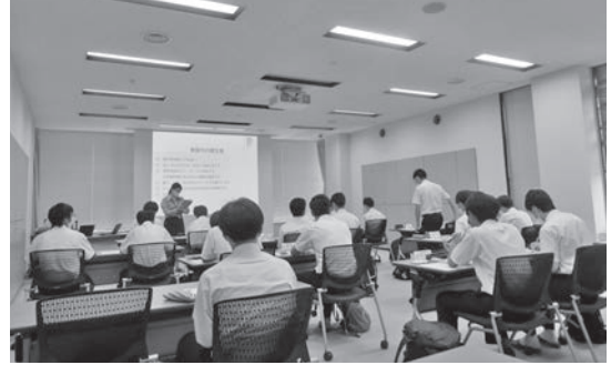
株式会社 群馬銀行