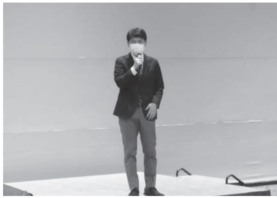
山本知事によるご挨拶