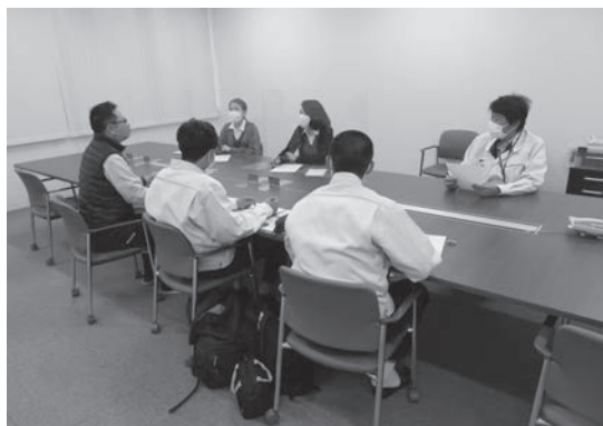
株式会社 アイ・ディー・エー