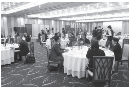
忘年懇親会の様子