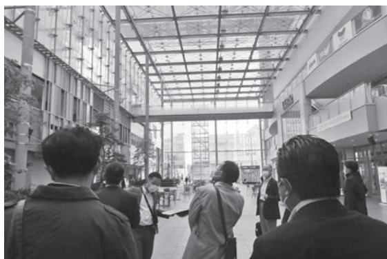
グランドプラザにて

今回の国内まちづくり視察では、公共交通を軸とした拠点集中型のコンパクトなまちづくりを目指し官民協働で取り組み、公共交通の利用者数増加や転入人口の増加などコンパクトシティ施策の成功事例として学ぶべきことも多く、限られた日程ではあったものの、密度の濃い充実した視察となった。