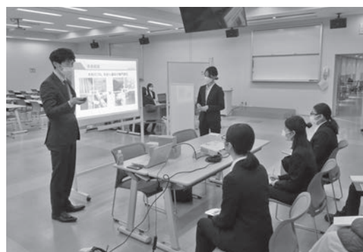
企業・業界研究セミナーの様子