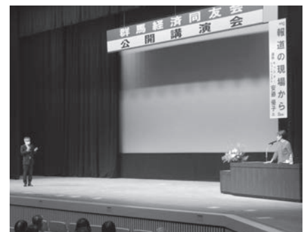
大竹副代表幹事による御礼挨拶