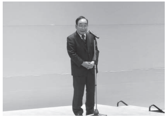
富岡高崎市長によるご挨拶