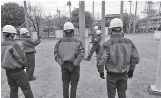
東京電力パワーグリッド 株式会社