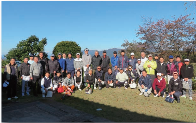
第75回 懇親ゴルフコンペ 赤城ゴルフ倶楽部にて