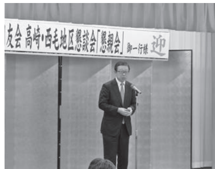
坂本代表幹事による閉会挨拶