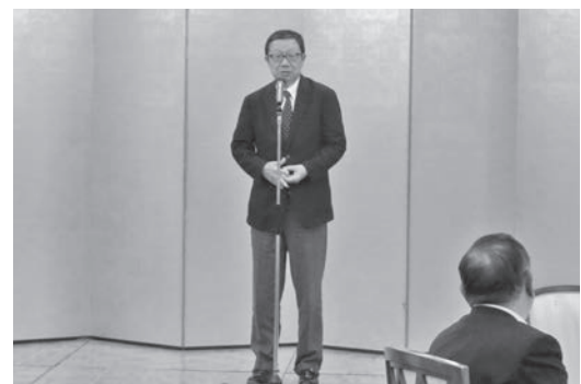
坂本代表幹事の挨拶で今年を締めくくった