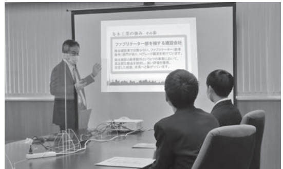
冬木工業 株式会社