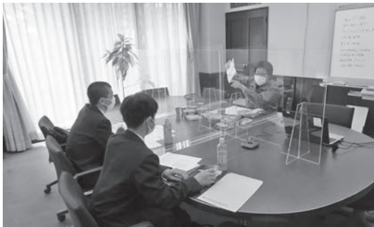
株式会社 富士製作所