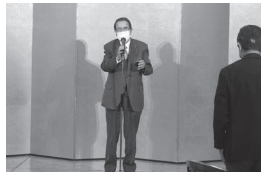
町田副代表幹事による乾杯