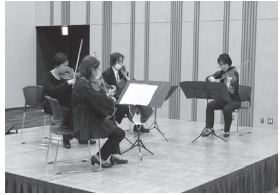
群馬交響楽団による演奏