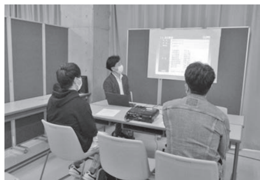
業界・業種研究会の様子