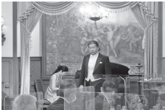
ミニコンサートの様子

昨年度はコンサートのみだったが、今年度は3年ぶりに懇親会も開催となり、静かで豊かな自然の中にたたく赤白のレンガ造りの英国邸宅でシェフ自慢の料理をご堪能いただいた。