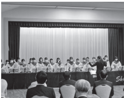
新島学園聖歌隊による演奏

2023年2月1日（水）、第4回幹事会に引き続き、高崎・西毛地区懇談会をホテル磯部ガーデンで開催した。演奏会の部では新島学園聖歌隊によるハンドベル演奏が行われた。地元会員様にも多数ご参加いただき、続いて開催された懇親会は、相互の親睦と交流を図る貴重な機会となった。