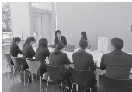
業界研究セミナーの様子