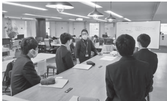
株式会社 リクルート北関東マーケティング