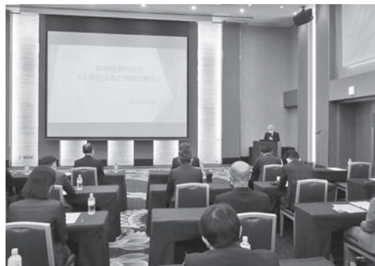
本田次世代育成委員長による趣旨説明