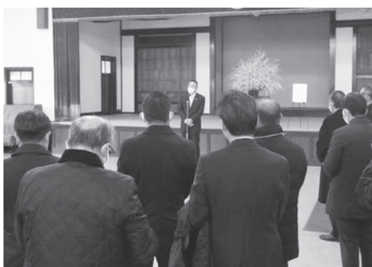
榎本富岡市長より歓迎を受ける