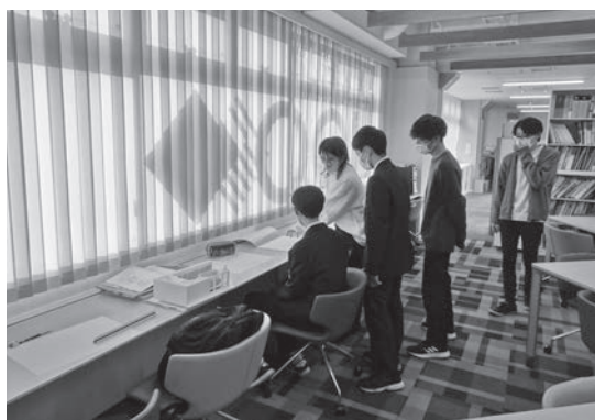
株式会社 石井設計