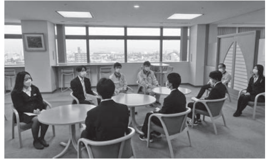
佐田建設 株式会社