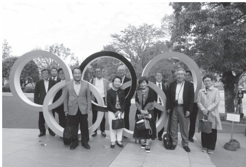
日本オリンピックミュージアムにて

新型コロナウイルス感染症の影響により3年ぶりの開催となったが、天候にも恵まれ充実した視察会となった。