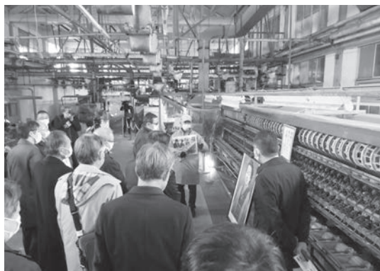
富岡製糸場を視察