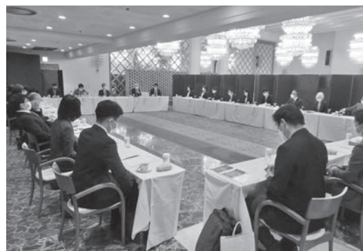
情報交換会の様子