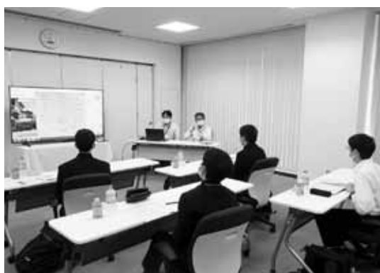
東京電力パワーグリッド(株)