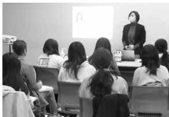
群馬ヤクルト販売(株)