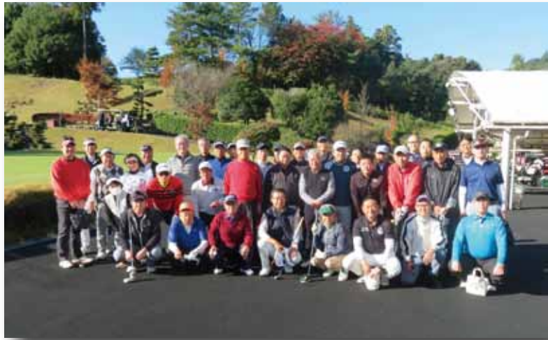
第73回 懇親ゴルフコンペ 高梨子倶楽部にて