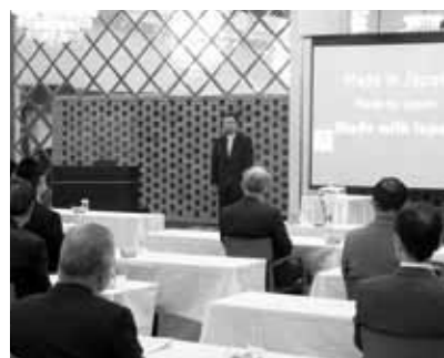
坂本代表幹事のご挨拶で一年を締めくくった