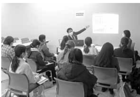
全国農業協同組合連合会群馬県本部