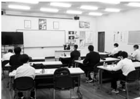
群馬ヤクルト販売(株)