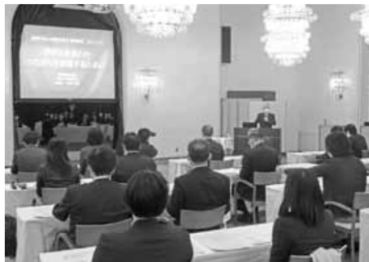
本田次世代育成委員長による趣旨説明