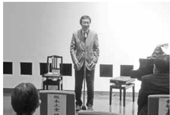
坂本代表幹事による閉会挨拶