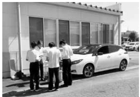
群馬日産自動車(株)