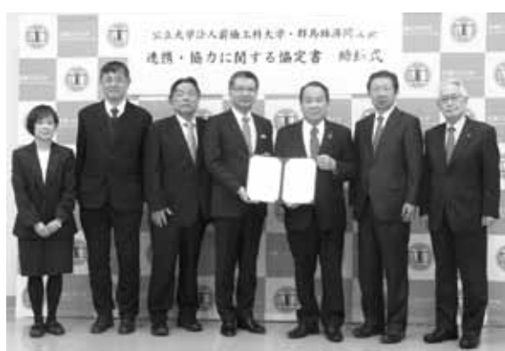
公立大学法人前橋工科大学との包括連携協定式