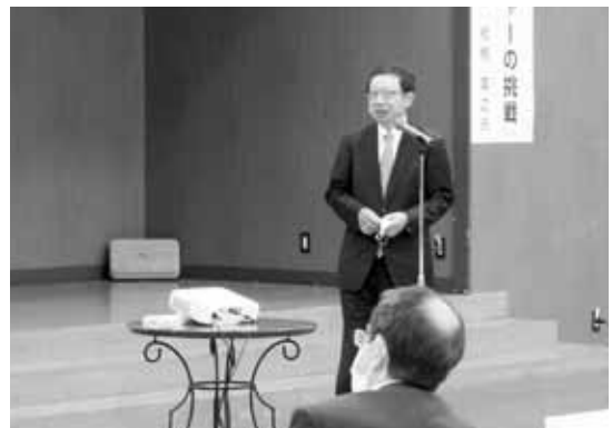
坂本代表幹事によるご挨拶

※なお、第4回幹事会後に開催を予定していた高崎・西毛地区懇談会は、新型コロナウイルス感染症の影響により中止となった。