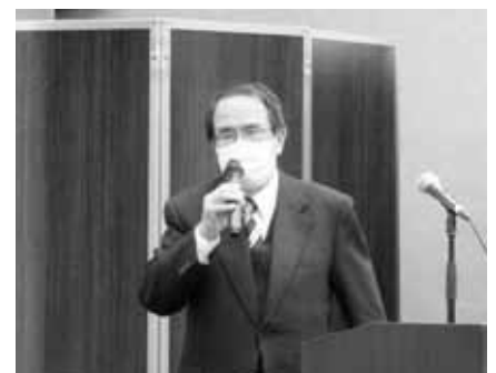
町田副代表幹事による御礼挨拶