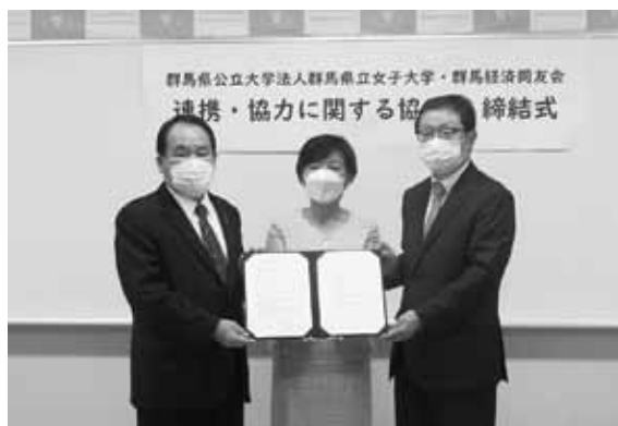
群馬県公立大学法人群馬県立女子大学との包括連携協定式

昨年度の国立大学法人群馬大学、共愛学園前橋国際大学、新島学園短期大学に続き、連携先は群馬県内5大学となった。