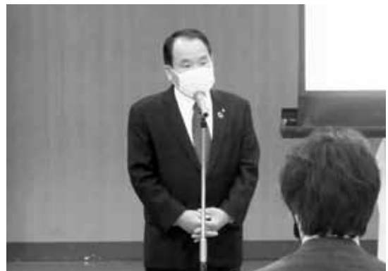
齋藤代表幹事によるご挨拶