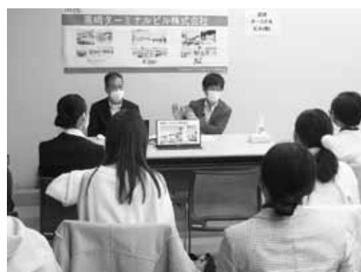
高崎ターミナルビル(株)