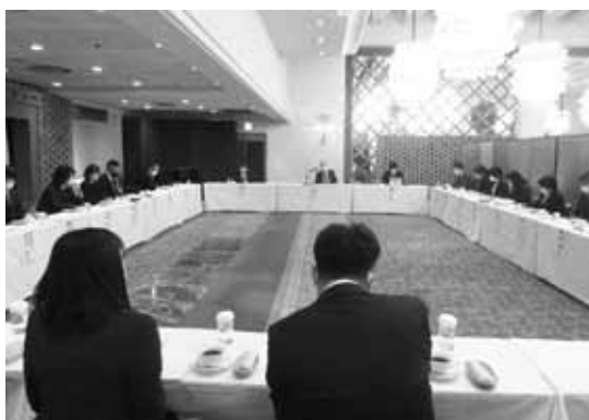
2グループに分かれて活発な情報交換会が行われた